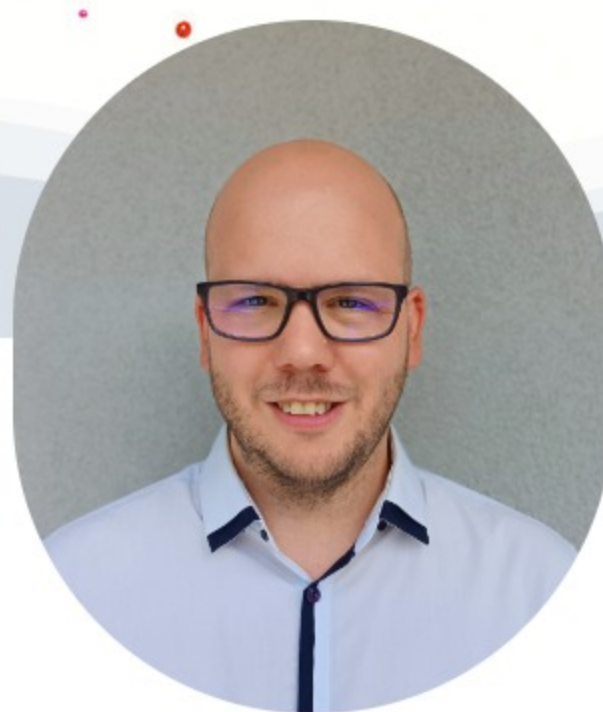
Coach en bilans de compétences

« les êtres humains ne sont pas des problèmes en attente de solutions mais des potentiels en attente de déploiement » (F. Laloux)